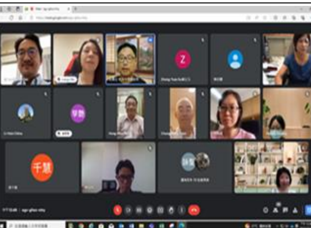
相片 4:活動照片 3