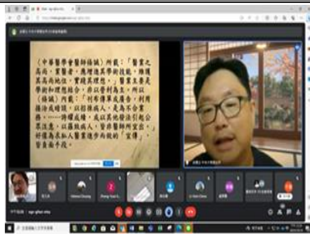
相片 2:活動照片 1