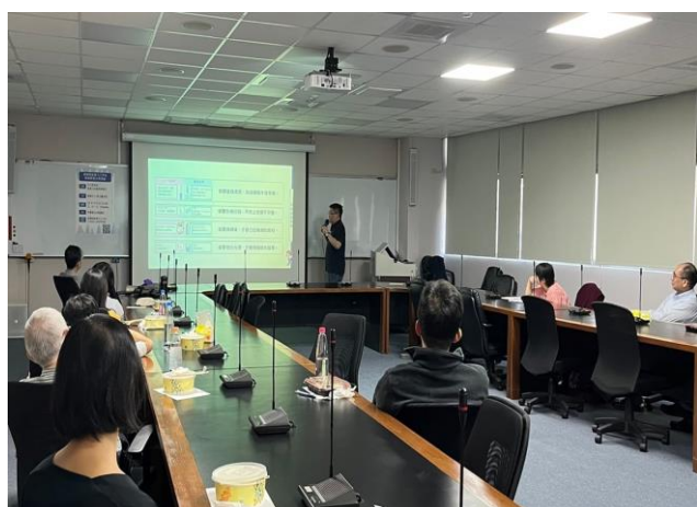
相片 3：活動照片 2