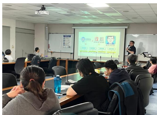
相片 4：活動照片 3