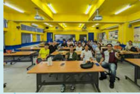
圖 / 醫工系師生相見歡大合照