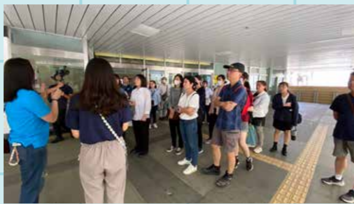
圖 / 宿舍老師介紹良善宿舍空間