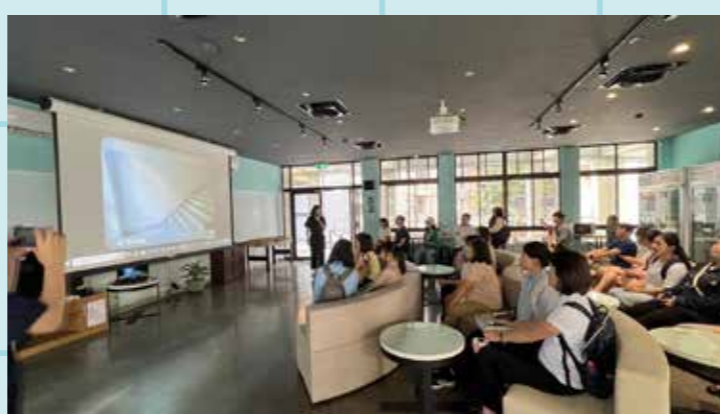
圖 / 家長及學生參與恩慈宿舍導覽

這次的宿舍空間導覽，一共吸引311位家長及學生參與，沿途甚至有臨時加入的家長及學生，對校園宿舍充滿好奇。隨著領頭學長、姐的介紹，使大家可以感受到友善的校園環境，並實際體驗到住的空間，豐富學前體驗。藉由本次活動，相信家長及學子充分參觀過新生宿舍與校園環境後，能對中原大學的認識更加深刻！