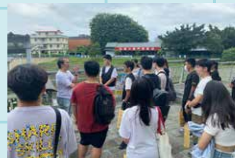
圖 / 機械系校園巡禮