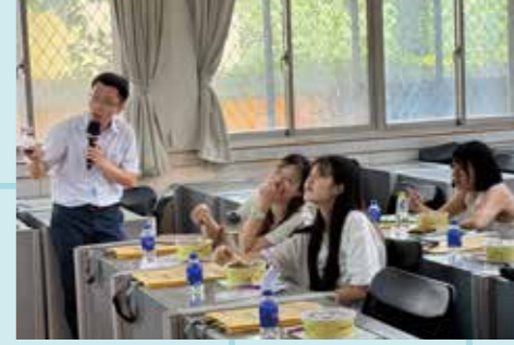
圖 / 財金系學系特色介紹