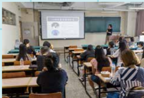
圖 / 心理系學系特色介紹