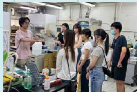
圖 / 化工系研究空間體驗