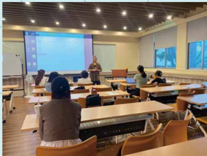
圖 / 講座照

以上課外活動的參與使我成長許多，學校活動資源真的很豐富多元，鼓勵學弟妹們可以從參加活動中慢慢摸索，希望未來學弟妹們也能夠創造屬於你們自己獨有的大學生涯。