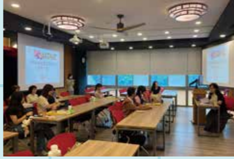
圖 / 應華系主任熱情歡迎準新生來訪