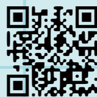
第二階段面試宿舍導覽影片