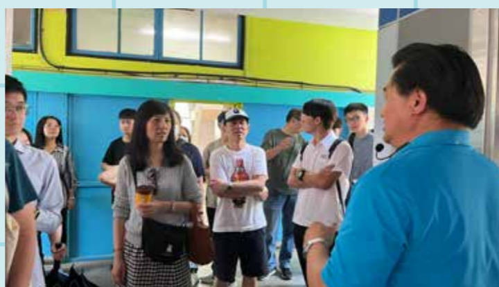
圖 / 宿舍老師介紹力行宿舍環境