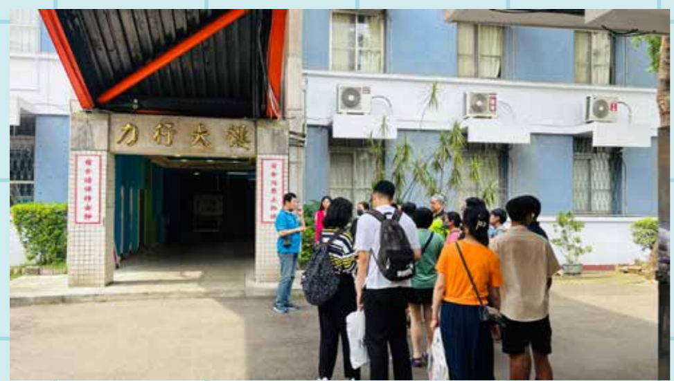
圖 / 家長及學生參觀力行宿舍