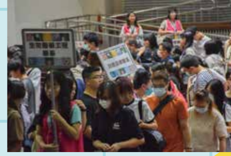
圖 / 活動入場