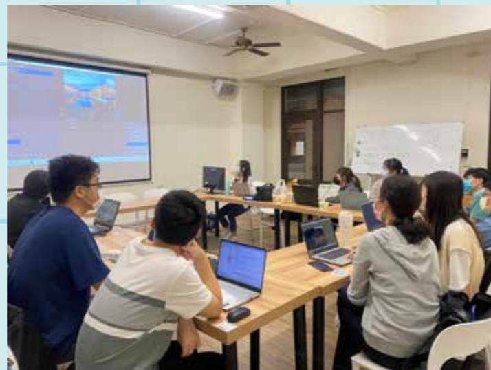
圖 / 社團社課