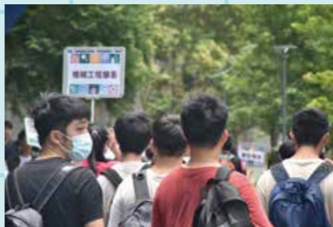
圖 / 校園環境巡禮

這次的大學生生活與校園介紹暨宿舍巡禮活動報名人數共565人，相信來參加的準新生們，對於學系相關學習規劃及校園生活有更明確的方向，並順利與大學生生活接軌。