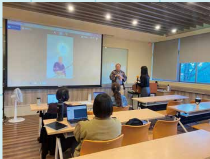
圖 / 講座照