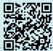
校園介紹與宿舍巡禮影片