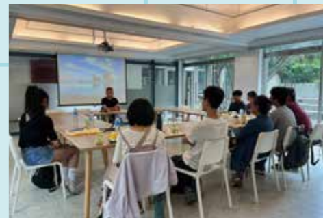
圖 / 建築系主任介紹學系