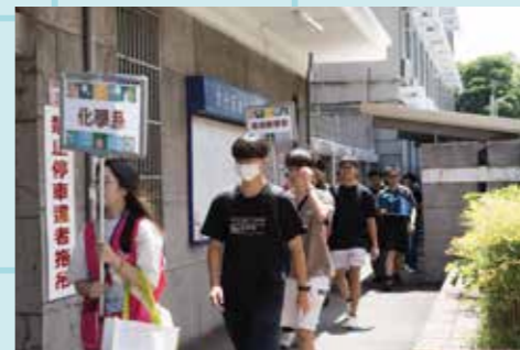
圖 / 準新生參觀力行宿舍