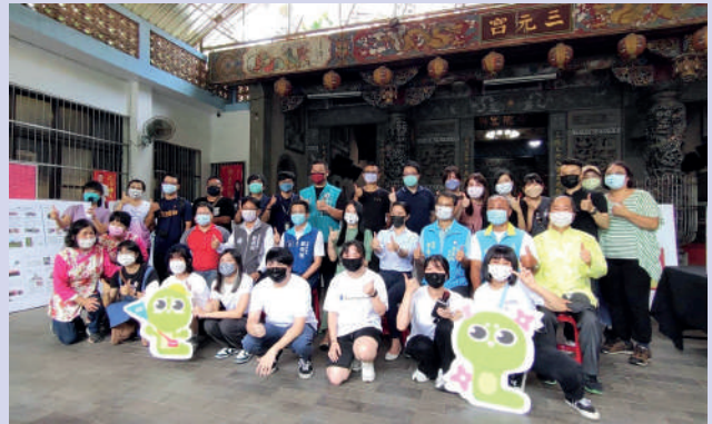
▲中原大學發揮社會責任為龍潭做設計，也感謝社區給學生最佳的學習舞台

中原師生再次走入三和，每項設計都非常有溫度，相信這樣的合作不論是對社會、對學生都是很大的助益。展望未來，中原大學將持續帶領學生深耕龍潭，將在地的自然環境、客家文化特色、傳統建築甚至美食祕境逐一盤點，讓地方更有活力。