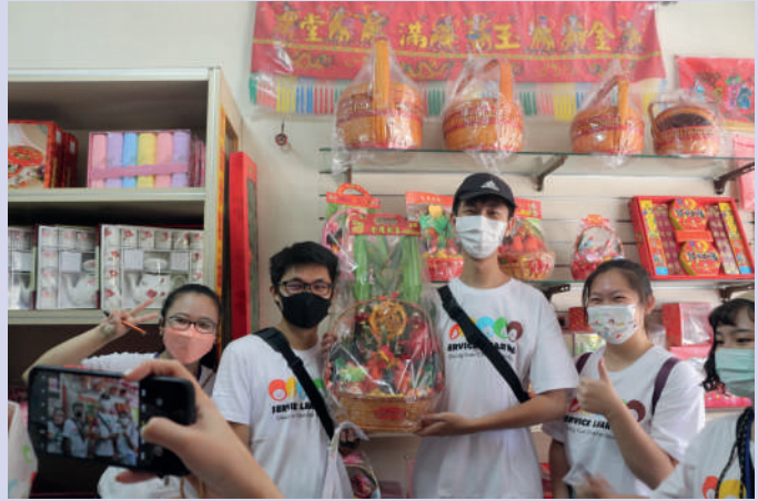
▲老店家組找到任務指定物品並合影