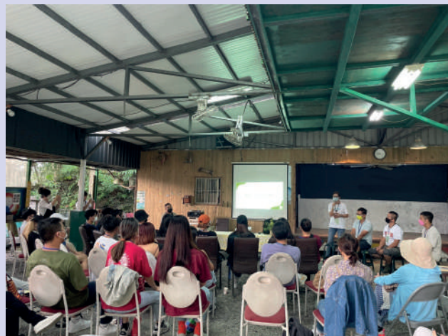
▲部落工作者分享返鄉遇到的生存議題