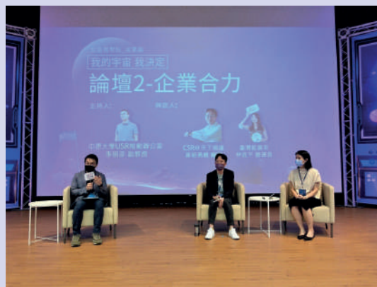
▲探討如何建構結合地方創生與企業合力的商業模式，打造良善共榮的環境