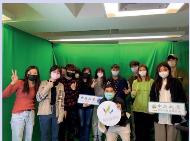
▲安東青創基地攝影棚