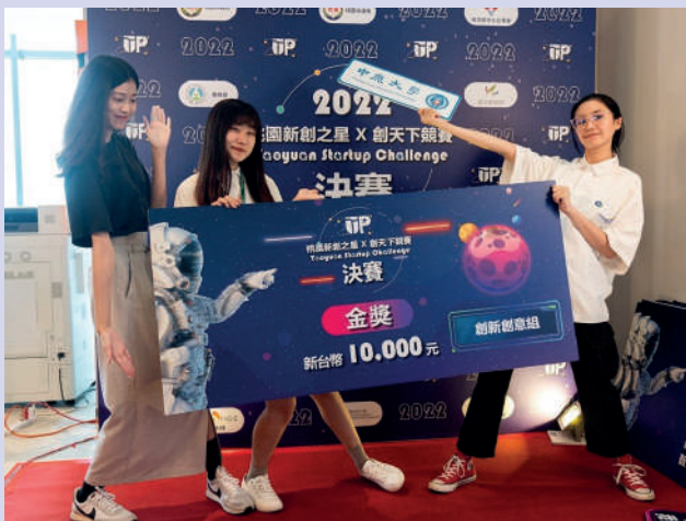
▲「素還真」團隊獲得創新創意組金獎

產學營運處將輔導各組冠軍團隊參加「桃園新創日」及「Meet Taipei創新創業嘉年華」，為有志創業的青年鏈結創投資金及國際市場，讓創意從構想走向創業！