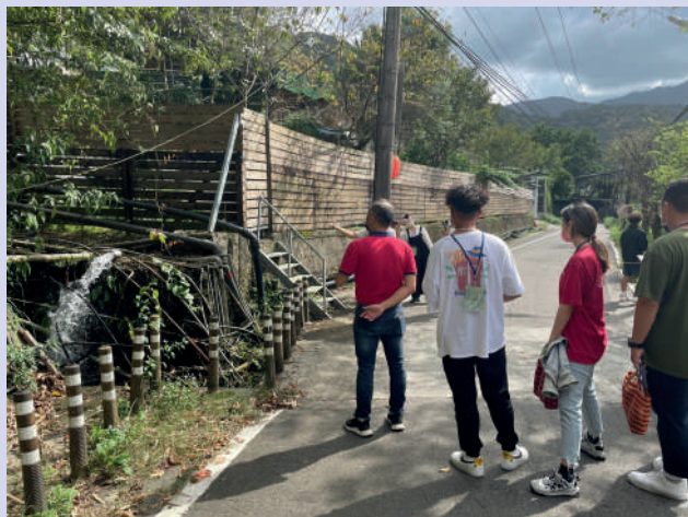
▲實際走訪，瞭解水源頭的重要性

9月21日由桃園市政府青年事務局主辦，中原大學原住民族學生資源中心、大學社會責任推動辦公室協辦之「聽見地方原生力」參訪活動，邀請大專院校師生前往忠治部落，透過地方創生團隊的解說以及部落工作者經驗分享，引導學生瞭解傳統文化及產業發展現況，本校參與學生共計15位。首先，由密切關注土地認同議題、新北市地方創生團隊「烏來·回家的人」帶領師生尋找水源頭，說明傳統水源規範、當代水源困境、水源之於部落的重要性等；接著，安排師生與部落工作者進行討論交流，透過對話瞭解青年返鄉所遇到的困難、對於青年人力的需求等。期望透過本次活動創造在地部落、學校與政府單位合作機會，為部落媒合更多青年人才。