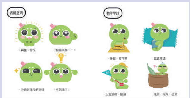
▲學生為閱過山丘書店設計充滿好奇心、喜歡冒險的吉祥物小書蟲SUSU