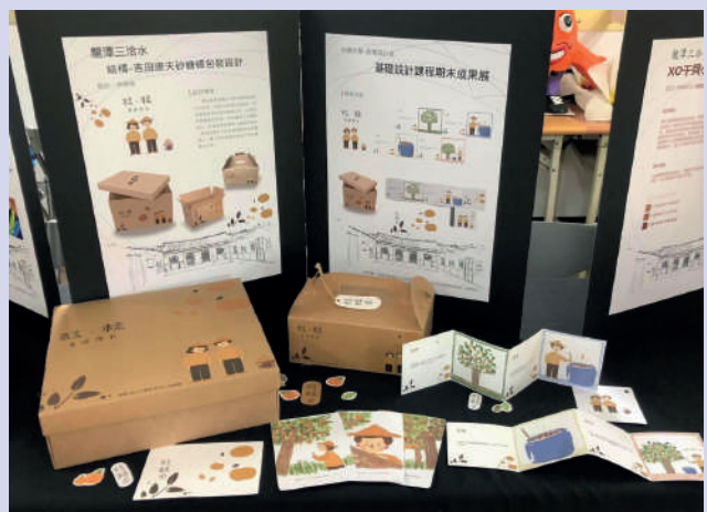
▲學生為龍潭返鄉青農設計農產品包裝及品牌經營