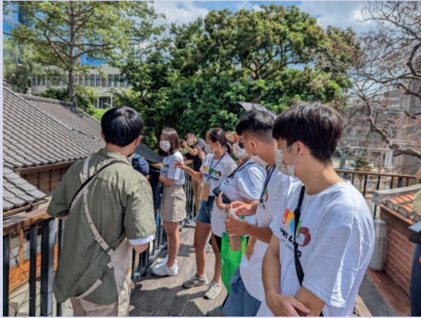
▲老建築組走訪中壢區歷史建築

服務學習中心規劃每年舉辦「國際工作營」，邀請不同文化與生長背景的學生一起認識「地方」，連結自己成長的國家 / 故鄉，並成為《原·頁》誌共創夥伴，透過故事讓更多人對「地方」產生共鳴！