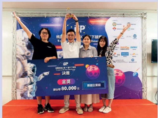
▲「智穎智能」團隊獲得新創企業組金獎、以及企業挑戰組獎項