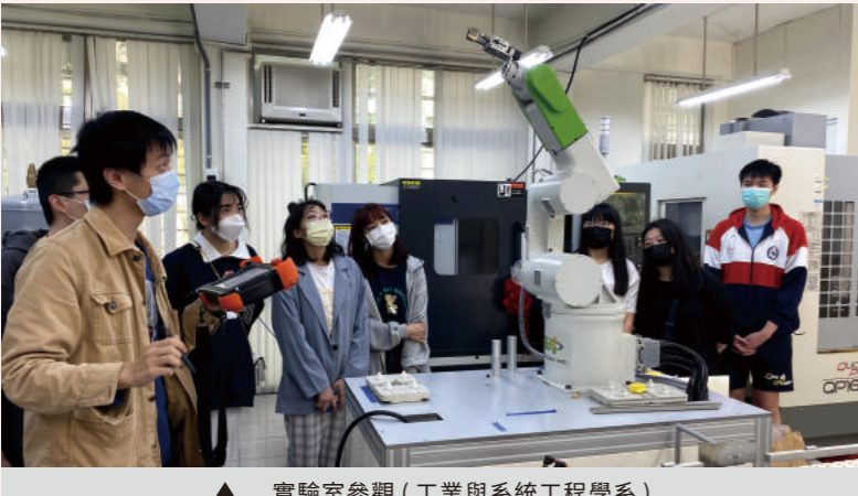
▲ 實驗室參觀 (工業與系統工程學系)