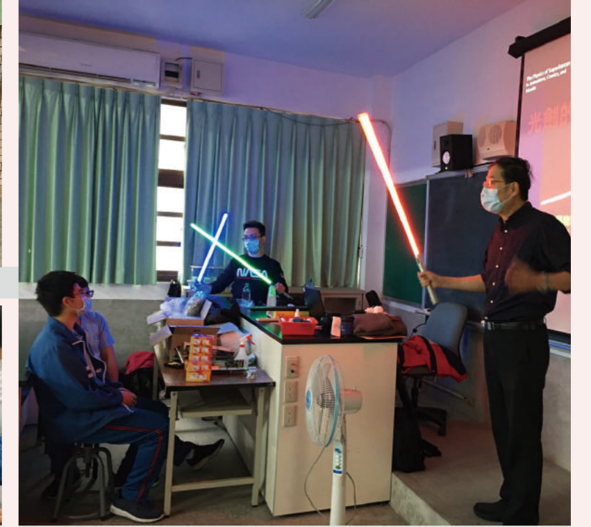
▲ 物理系許經委教授解說光劍原理