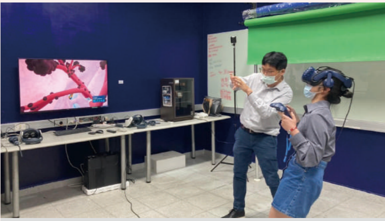
▲ 學系活動體驗 (生物醫學工程學系)

本次活動報名的人數為 489 人（含家長），其中包括：六和高中之學生團體報名。藉由本次體驗營，相信高中學子們皆能了解各學系系所空間、課程內容、未來展望等，體驗到不同的學習經驗與知識，也對未來的學系規劃更加明確，得以進入最適合自己之大學、生涯學系。