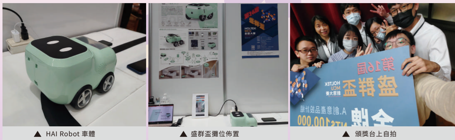
▲ HAI Robot 車體 ▲ 盛群盃攤位佈置 ▲ 頒獎台上自拍

我覺得難能可貴之處是同學能關心時事與能團隊合作，互相包容。學生從最開始的設計到後面把功能一個一個實現出來，就是不斷學習的過程。學生要不斷的去找方法解決問題，雖然一定會碰壁，還是要不斷的想辦法去解決，不斷搜尋資料，認真去看元件規格書，或是問老師，透過不斷學習和嘗試才能把東西做得更好。跨領域學習逐漸成為趨勢，單就一個專業領域的人是沒有辦法開發一個完整產品的，所以也藉比賽積極和商設系同學合作，讓學生有機會跨領域學習。很高興學生的努力能得到「第十六屆盛群盃 HOLTEK MCU 創意大賽」創意產品設計組金牌獎的肯定。