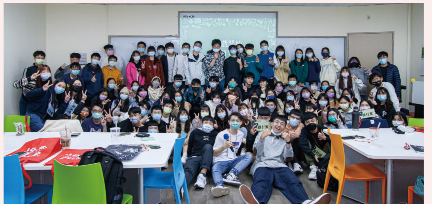
▲ 財務金融研習營大合照