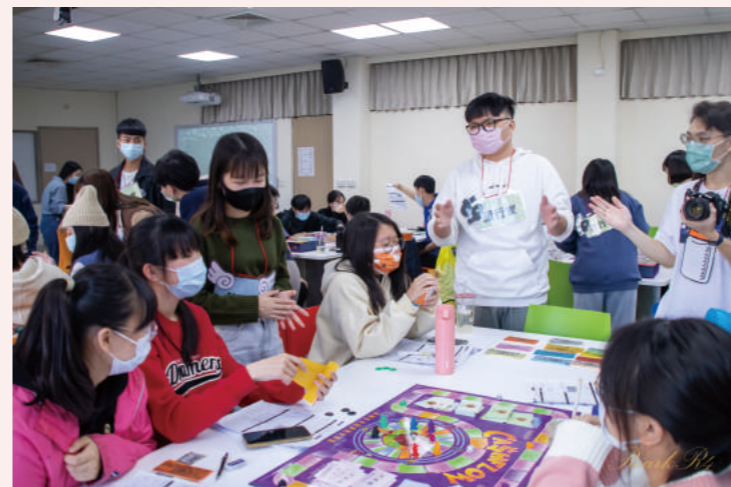
▲ 助教親自指導現金流桌遊操作

學生分享：課程中老師除了給予我們許多對於理財方面的知識，讓我們對於理財能有更進一步的了解，藉由下午的現金流活動更是從遊戲中找出自己對於理財的理念及想法，並且知道在不同的財務狀況下自己會如何調整與改進，創造更大的財富。