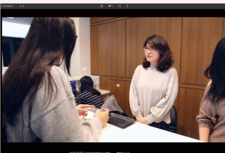
▲ 課程融入情境式對話情節