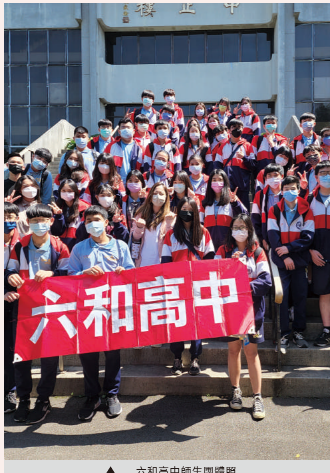
▲ 六和高中師生團體照