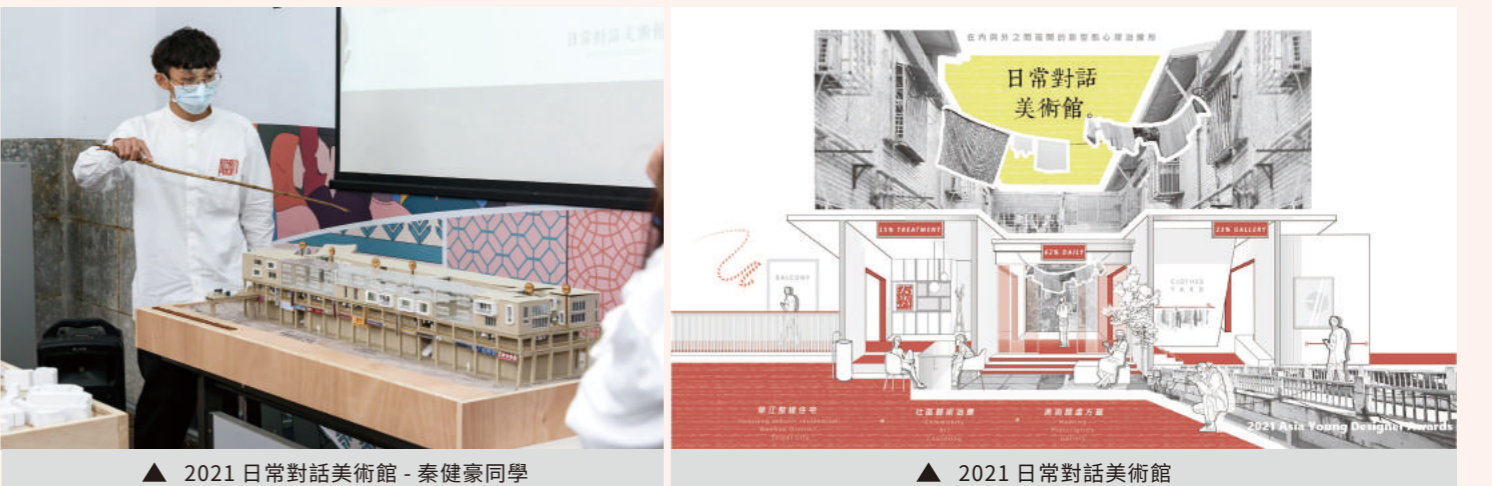
▲ 2021 日常對話美術館 - 秦健豪同學 ▲ 2021 日常對話美術館

《日常對話美術館》在充滿不確定性和壓力的時期，沮喪和情緒的低潮儼然成為現代人日常生活的一部分，然而心理治療卻往往被視為封閉、隱晦的行為。本案試圖消弭那道無形的高牆，藉由從心出發，以「讓心理治療所進入社區」為主軸，規劃在台北市萬華區的華江整建住宅打造一處「日常對話美術館」，在社區當中透過空間的設計，企圖誘發與引導其中的使用者在潛移默化的對話裡，體驗同理心帶來的良好療癒，不但可活絡社區，更縮短心理治療診所與人們的距離。中原室設推動的「永續關懷」理念，我從中學習到如何透過觀察、了解現況到發現問題，以同理心出發落實貼心設計，關心特殊的需要，設計特別的關懷。