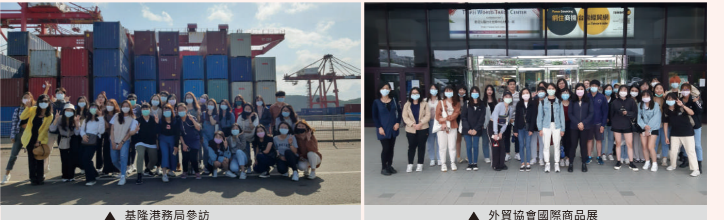
▲ 基隆港務局參訪 ▲ 外貿協會國際商品展

想要申請國際經營與貿易學系的同學，可以先透過本系網站了解課程內容及未來出路是否符合自己的興趣。而在學習歷程部分，可以多參加商業營或相關的講座、外語能力的檢定或競賽、商業相關課程或專題，以及志工服務或與自我能力提升有關的活動，以上都可以幫助審查委員更了解申請者的動機與能力是否具有成為國際商務專業人才的潛力。