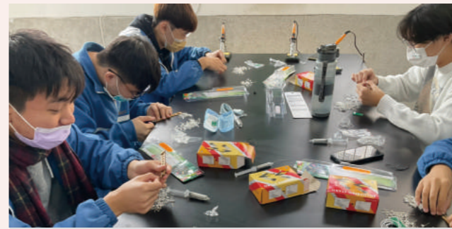
▲ 學生動手組裝光劍