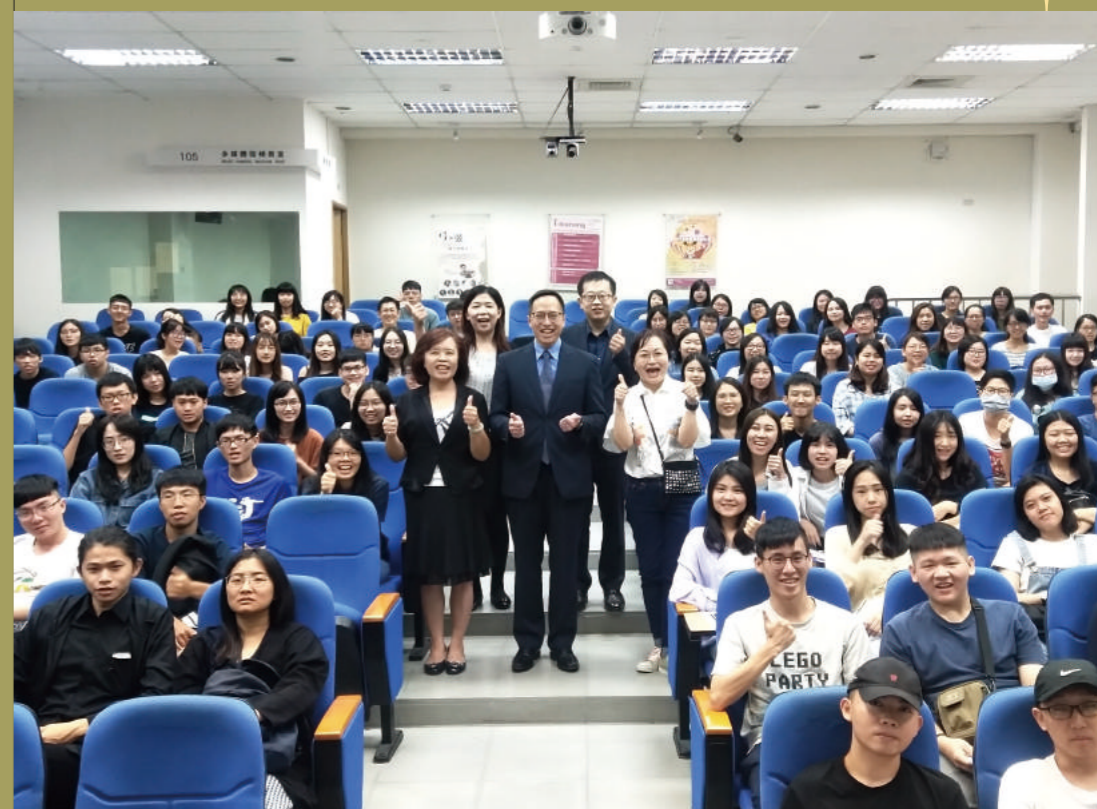
▲ 安侯建業聯合會計師事務所校園徵才說明會

· 產官學研合作：結合產業界、政府機構、學術界、研究機構之資源，各系推動設置研究中心，持續精進學術研究的質與量。