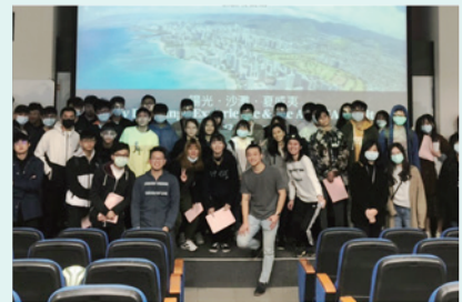
▲ 嚕嚕世界交流系列講座