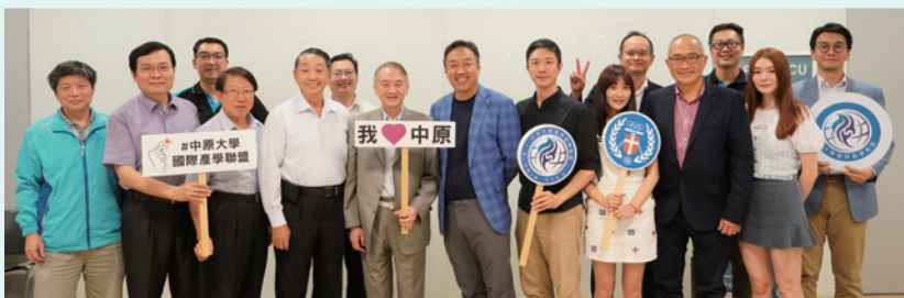
▲ 中原大學、紅灣跳動、亞洲鑫灣投資簽署合作意向書儀式