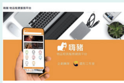
▲ 環形工作室企劃物品租賃服務平臺