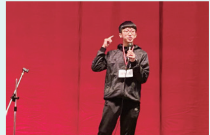
▲ 109學年度英語演講比賽

藉由多樣性的課堂學習與課外活動，相輔相成，全方位培育學生具備學用合一的能力，達到提升其學習英語之動機、鼓勵出國研修與深造的動力、考取英文證照等目的。