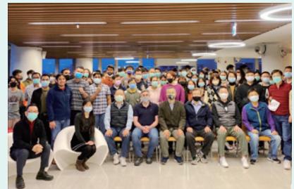
▲「牛轉乾坤賀新年」活動合影

小年夜親自前往熱誠宿舍送給外籍生、僑生及陸生，讓境外生們感受新春佳節的溫情暖意。