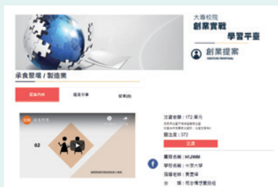
▲ HIJWM團隊「承食聚場」募資情況

創發中心未來將針對各團隊需求媒合業界專家顧問的輔導，待注資結果公告，教練團將協助創新團隊進行實作規劃，實踐完整的創業教育學習。