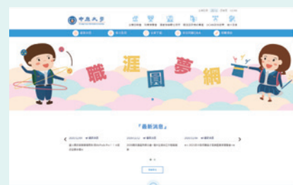
▲ 中原大學職涯圓夢網

職涯輔導中心希望透過職涯圓夢網，提供中原人進行更便利且實用的數位化職涯體驗，提升自主職涯規劃意識，及早打造個人堅實的職涯軟實力。