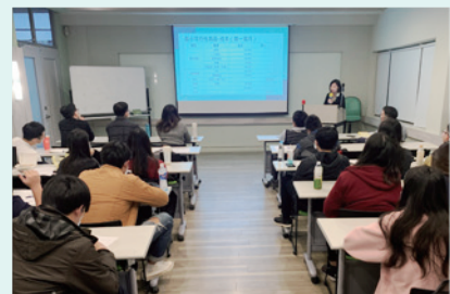
▲ 企業管理學系管理實境解題課程