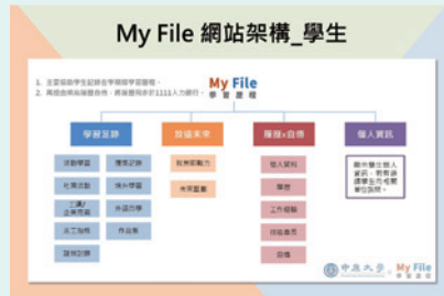
▲ My File網站架構

My File系統建置重點包括：(1) 以品格、專業、創意、世界觀為主軸彙整資料，學生可依不同主軸檢視自我於各面向的表現。(2) 有別於一般e-portfolio僅蒐集學生修課記錄、社團記錄等結構化資料檔案，「My File雲端個人檔案系統」蒐集的資料更廣，它能彙整各種非結構化形式資料檔案，包括學生個人發表的作業文字、聲音、照片、社交網站資料、微電影資料等，並依不同主軸儲存於雲端個人檔案空間。(3) 有效彙整本校其他系統的學生學習資料與成果