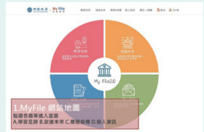
▲ My File網站首頁

表現，如個人學習與發展計畫、成績管理系統、i-learning系統、C-Map學生指標能力系統、學生自主學習活動、全人認證系統等，增加資料的運用價值。