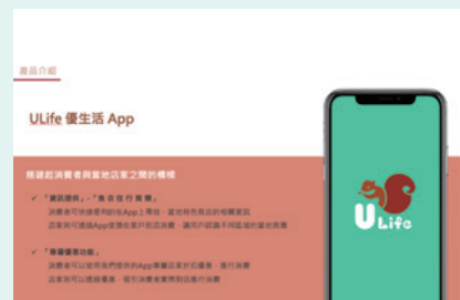
▲ 優生活團隊「Ulife優生活」提案