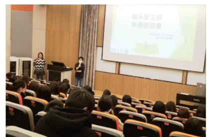
▲ 輔系雙主修說明會

教務處每學期舉辦輔系、雙主修申請說明會，除介紹申請方式、獎勵措施外，並邀請完成輔系或雙主修的學長姐們分享修課經驗，亦期望各位師長能鼓勵學生修習，優化學生多元跨域能力。