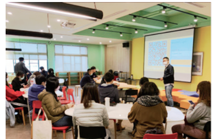
▲ 透過app、網頁及軟件等進行數位科技教學法之教學

中原大學因應新冠肺炎疫情進行「遠距教學防疫演練」，本學期學生學習發展中心除辦理原訂的教學助理培訓會7場；為讓教學助理能協助處理教師遠距教學問題及掌握學生到課情形，偕同全校各教學單位，自109年3月19日至4月23日辦理55場「非同步教材製備軟體操作暨同步線上互動討論之混成式教學」研習，培訓全校教學助理具備i-learning平臺操作及EverCam/Loom線上教材錄製的相關知能。