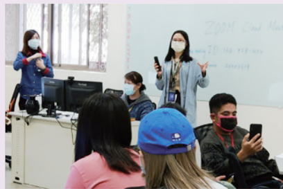
▲ 同步 / 非同步遠距授課軟體講解

因應防疫，中原大學密集開設助教培訓會，輔導各課程助教們熟悉同步 / 非同步遠距教學軟體之使用。商學院配合學校政策，並有鑒於院內有許多招收外籍生的學程，故