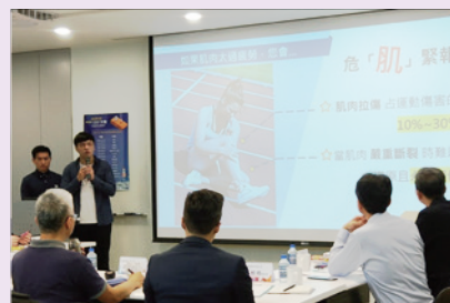
▲ 「芙體格」創業團隊進行簡報募資