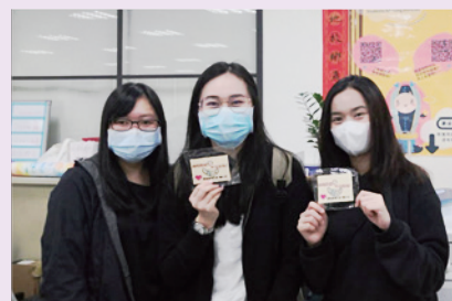
▲ 境外生領取可水洗式防塵口罩

可水洗3D防塵口罩，提供給未能購得口罩之境外生於出入公共場所時使用，也設置自動消毒噴霧機讓境外生能於洽公諮詢前做好乾洗手，在疫情期間保護自己也保護他人。