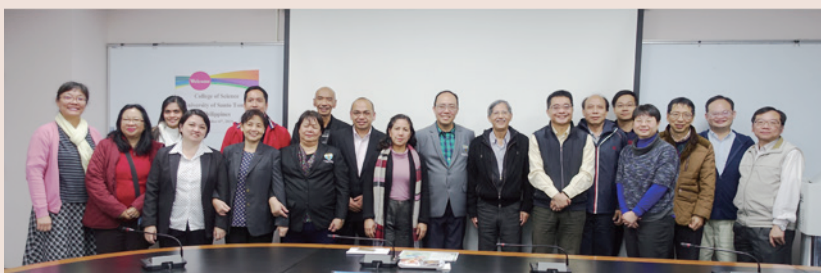
▲ 本校理學院師長及UST理學院學術交流團合照

座談會中雙方不僅希望未來能有更多學術合作機會與交流模式，會後聖多瑪斯大學理學院學術交流團實地參觀理學院各學系實驗室，對本校學術研究項目獲得更深入的瞭解。