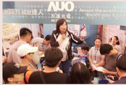
▲ 實習博覽會中學生投遞履歷情形

「職涯探索與輔導」行動方案推動「UCAN職業興趣探索」普測，108年度大一施測人次為2,985人次；使用UCAN平臺之專業職能測驗，使用人次為3,758人次。本年度首次建立以Holland碼職涯選擇理論為基礎的職涯輔助試算表，發揮以大數據落實學生學涯與職涯發展之指引功能。