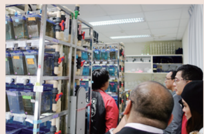
▲ 參觀生科系實驗室