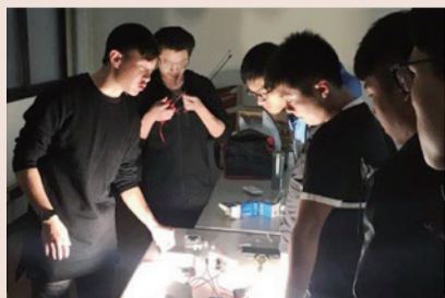
▲ 學生分組進行「雙切開關」實作

以「高等電力系統（基礎課程）」及「電力實驗（延伸課程）」為例，課程規劃針對社區進行節能改善之輔導，學生學習目標設定為節省電費及維修電器，鼓勵學生將課堂上所學習到的電力知識運用在實際的生活