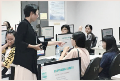
▲ UCAN測驗活動學生分享