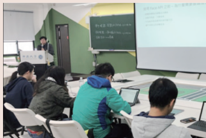
▲ Microsoft Azure AI平臺訓練課程

「教學革新知能深造計畫」從傳統學科領域探究學術研究，導入教育哲學理論，擴大教與學的過程及研究方法，以此作為創新教學設計概念，落實「教師學習社群」、「選定教學主題進行探究」提供教師創新教學培訓、規劃合作社群、提倡全英語教學、教研發想分享平臺及激發教師教學潛能，以提升學生學習效能。