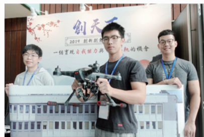
▲「打造屬於你的商業模式」創業課程

108年首度和業界企業合作，與XR Express TW、宏達國際電子、資策會數位教育研究所、躍馬中原基金會合辦「創天下」創新創意實作競賽，分成實境技術組、智慧科技組、社會實踐組與產業創新組。參賽隊伍來自34所大專院校、213組團隊、700多位學生。競賽由12位業界專家擔任評審，協助參賽學生將原有技術創新思想實體化。最後決選出12組優勝團隊，並獲得創新創業輔導資源挹注。