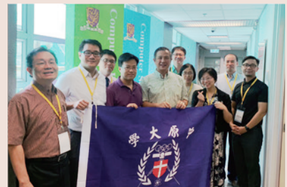
▲ 教師創新教學海外研修

「教學實踐研究計畫」為精進教師教學品質，加強學生學習成效，鼓勵教師以教學場域為研究，落實教學創新，以強化人才培