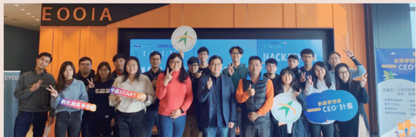
▲ 2020 Startup Hackathon 新創團隊

為期兩天的研習帶領團隊掌握募資要點，瞭解天使投資人的觀點與群眾募資市場的布局，為校內創新創業環境帶來最前線的資訊。本次活動共計9組團隊25位學生參加，整體滿意度為87.3%。