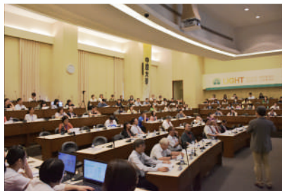
▲ 全國各大學教師踴躍參與論壇

活動共計有全國29所公私立大專校院149人與會。藉由這次會議期許透過各校交流意見讓高等教育的發展更多元、為社會培育更優質的人才，達到創新的產學合一。