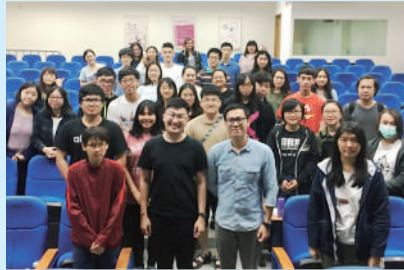
▲ 簡報策略思維課程

析，讓學生不斷思考尋找屬於自己的創業領域；再來，開始驗證學生的想法、產品及創業計劃，實際教學生如何用最小成本，製作出一個簡單的產品，並快速在市場上作驗證，透過市場不斷驗證、回饋來修正創業計劃及增進創新創業專業能力。