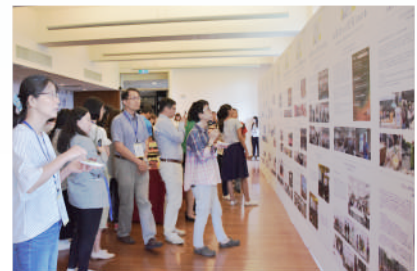
▲ 高等教育深耕計畫成果展示