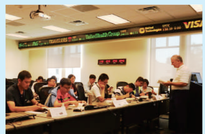
▲ 中原教師赴美SAU研修