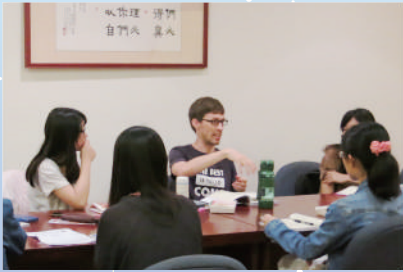
▲ 英文讀經班上課狀況

秉持中原大學全人教育的精神，培育「有信、有望、有愛」及才德兼備之中原人為目標，校牧室每學期舉辦學生英文讀經班，啟發學子思考人生的價值與意義，培養身心靈均衡發展的人格。