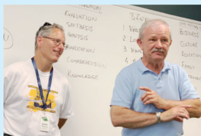
▲ 兩位SAU資深教授授課