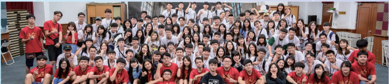
▲ 參與傳承與交流活動的社團幹部們大合照