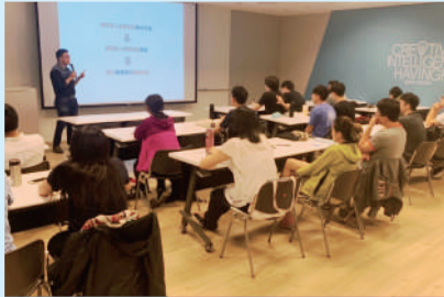
▲ 如何驗證最小可行產品課程