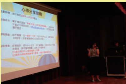
▲ 主辦單位於會中說明「成績進步講好文」徵稿活動

「先給自己一個嘗試的機會，再經歷努力不懈的過程，最終將有結實纍纍的收穫。」成績進步獎獲獎學生心得寫道。善用各式學習資源，培養良好讀書習慣，加上同儕激勵，讓求知更事半功倍。把握每次的報名，人人都可以成為成績進步獎的得獎者。