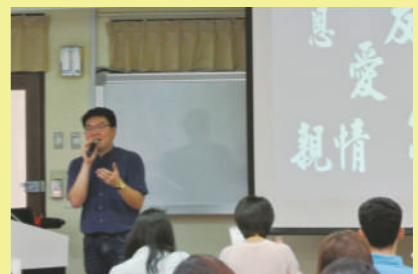
▲ 周文鵬從日本漫畫家藤田和日郎《潮與虎》談圖像閱讀與故事啟蒙