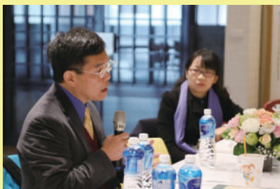
▲ 針對「倫理可不可以教」為題，進行教師座談。