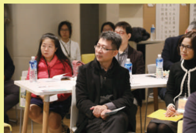
▲ 座談主題與交流內容均受各領域教師們關注

驗交流與分享，希望藉由中原大學的「平臺」角色，產生影響力，讓臺灣的倫理教育更能在校園及社會生根。