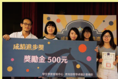
▲ 各組獲獎學生們上臺領獎合影