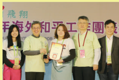
▲ 中原柬埔寨海外志工團榮獲金獎，接受陳副總統（左二）頒獎表揚。

中原大學在眾多參賽者中脫穎而出，柬埔寨海外志工隊榮獲金牌獎，緬甸海外志工隊及薩爾瓦多海外志工隊則均榮獲銅牌獎。學務長饒忻表示，中原大學鼓勵師長帶領學生走入人群，運用所學，服務社會，甚至走向國際，增廣視野。中原仍將於服務學習領域持續努力，並鼓勵更多師生共同投入這深具教育意義的行動。