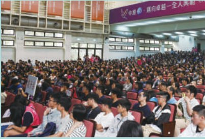
▲ 活動報名熱烈，會場座無虛席