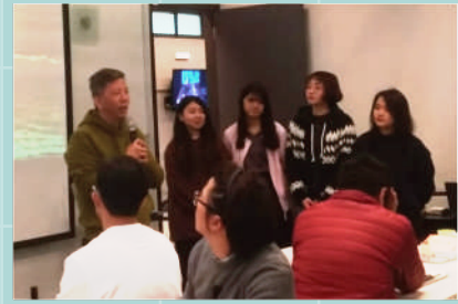
▲ 講解搭配學生分享

落實，並將設計成果投入觀光局國家風景區通用設計創意競賽。陳老師以輕快步調，詳細說明在學生案例中如何深化學習獲得學習成果，激盪出更多不同的火花。分享活動回饋佳評如潮。