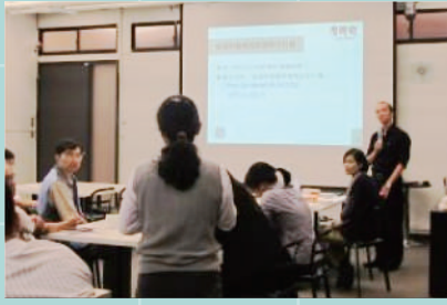
▲ 講解搭配學生分享