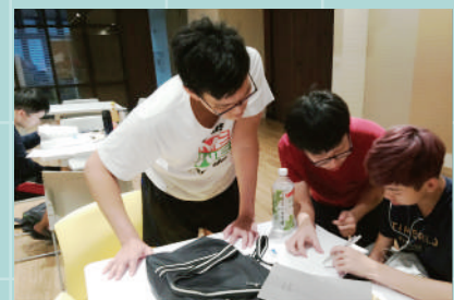
▲ 境外生期中課業輔導

參與課業輔導的學生們均在回饋意見留下正面評價，認為整體內容「有幫助」、「很棒」、「很好」、「讚讚讚」等等，也表示助教的「態度很好，很耐心，不會因為我不會笑我」。課輔小老師表示一對一教學具特殊性，更能有效幫助境外生銜接學習課程。