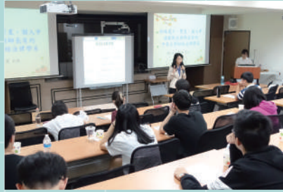
▲ 財法系的準大一新生與師長有約